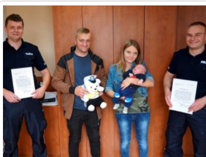
Wizyta w legionowskiej komendzie