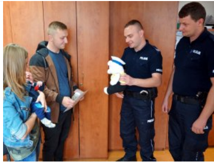
Wizyta w legionowskiej komendzie