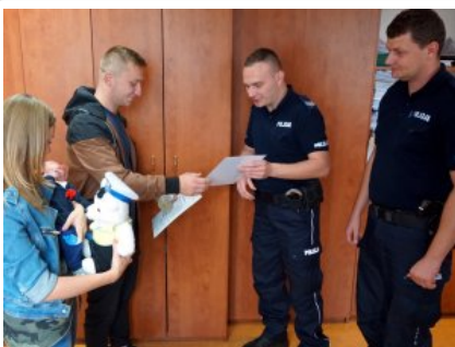
Wizyta w legionowskiej komendzie