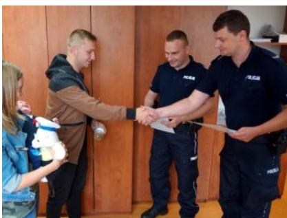
Wizyta w legionowskiej komendzie