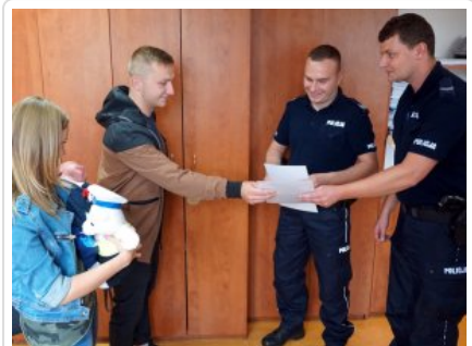
Wizyta w legionowskiej komendzie