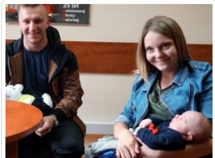
Wizyta w legionowskiej komendzie