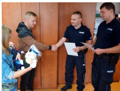
Wizyta w legionowskiej komendzie