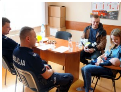
Wizyta w legionowskiej komendzie