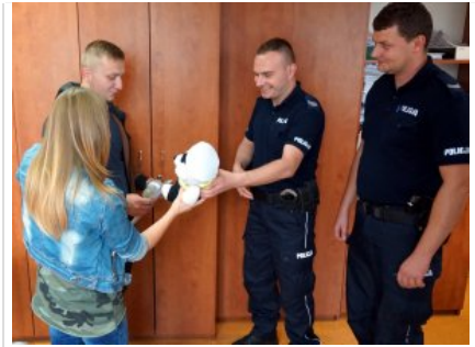
Wizyta w legionowskiej komendzie