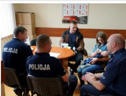
Wizyta w legionowskiej komendzie