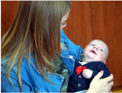
Wizyta w legionowskiej komendzie